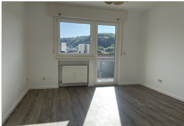
Erdgeschosswohnung renoviert 2023