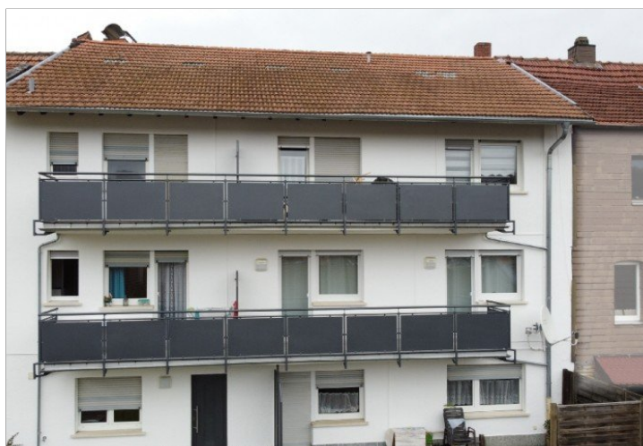
Gartenansicht - Drohne