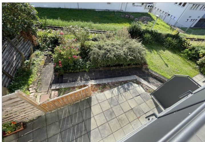
kleiner Garten der Hausgemeinschaft