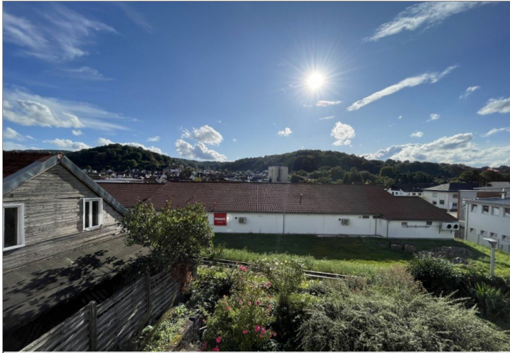
Ausblick von den Balkonen/Garten