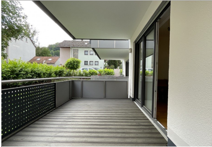
Balkon - Eingang Wohnen