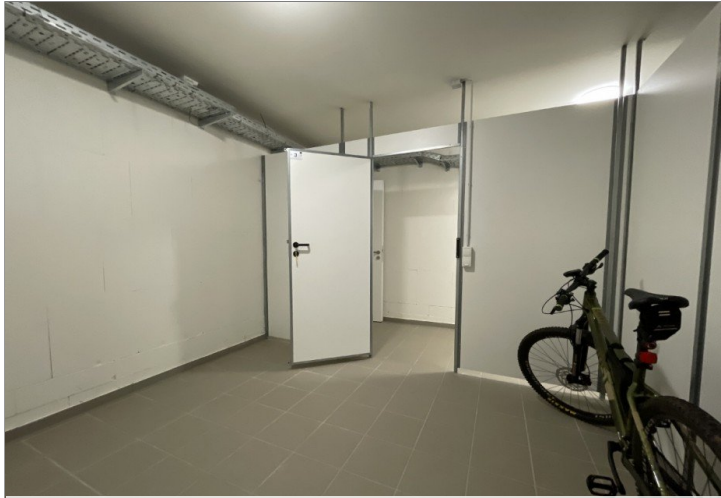
XXL Keller im Mietpreis enthalten