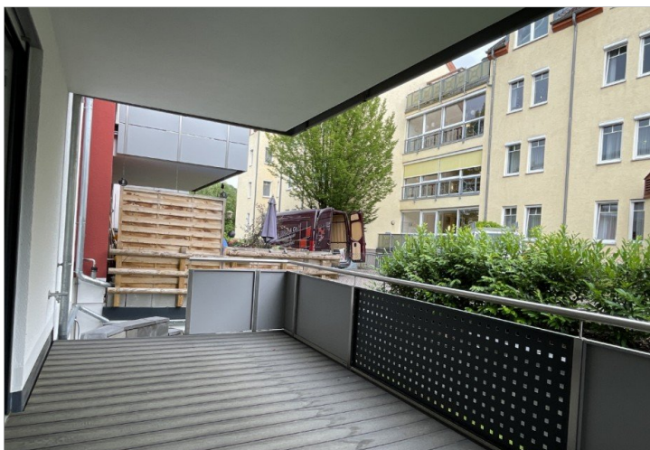
sehr großer Balkon