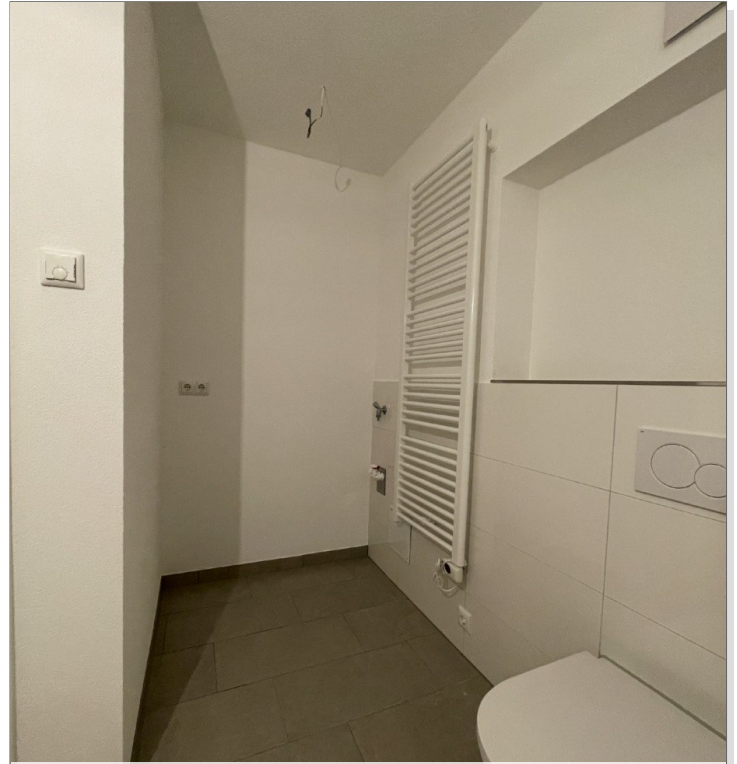
Bad und Waschecke