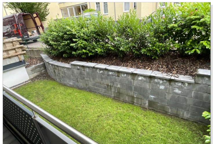
der CLOU: eigener kleiner Garten