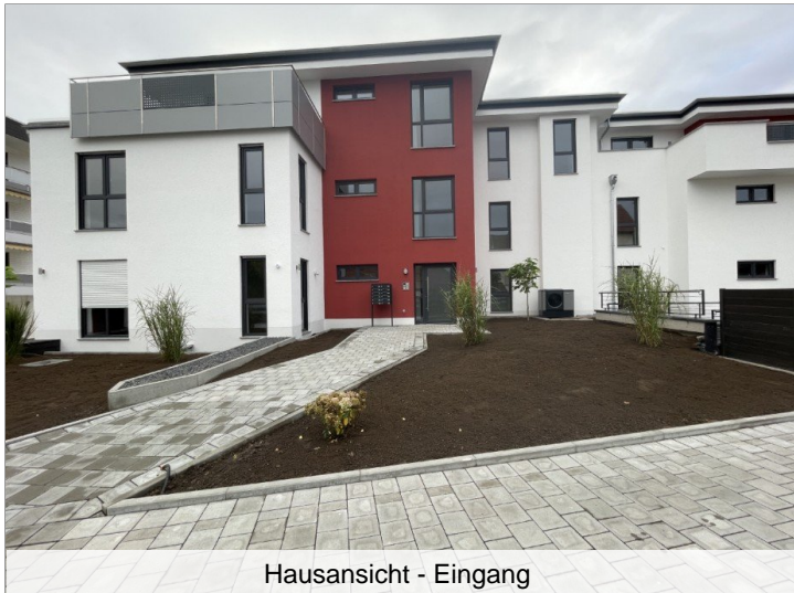
Hausansicht - Eingang