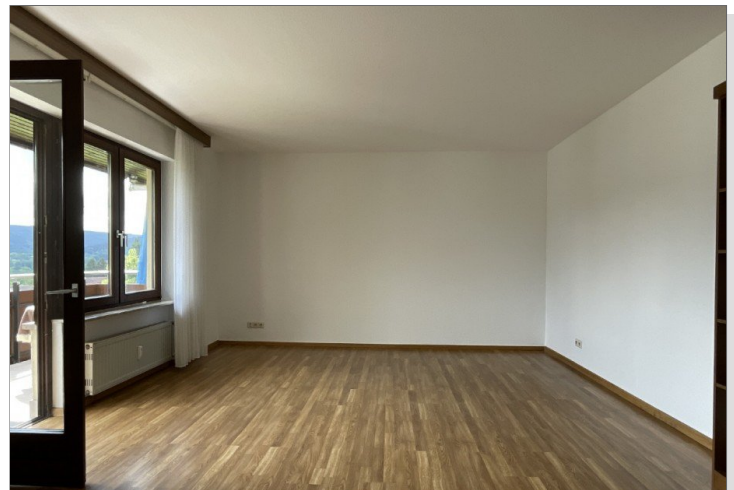
Wohnen - Balkon