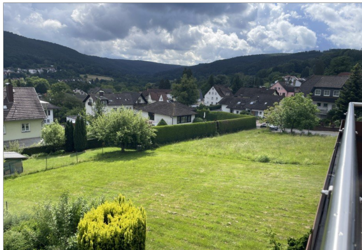
Aussicht in das Orbtal