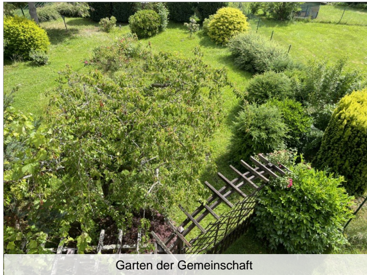
Garten der Gemeinschaft