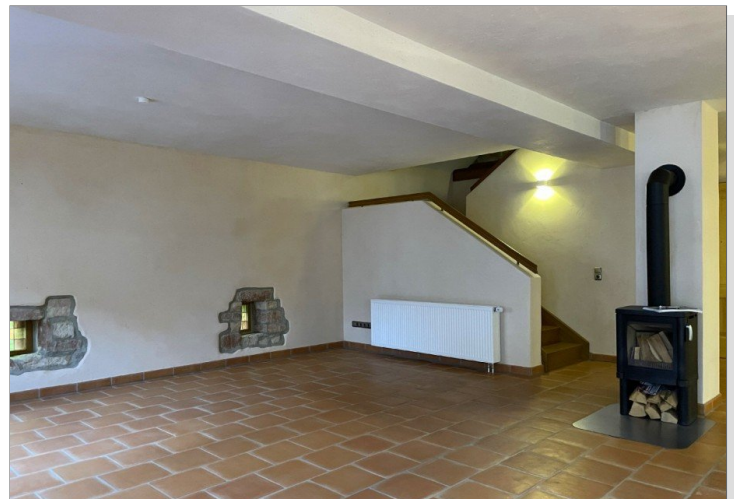
Wohnen Obergeschoss mit Holzofen