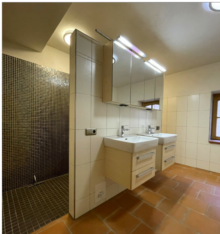
Bad mit Dusche und Wanne