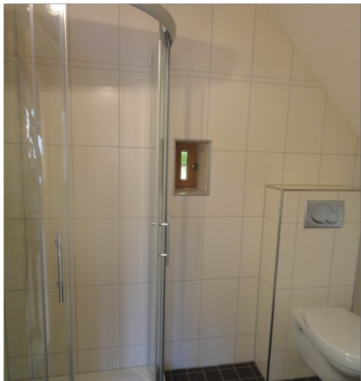
DG Duschbad mit ...