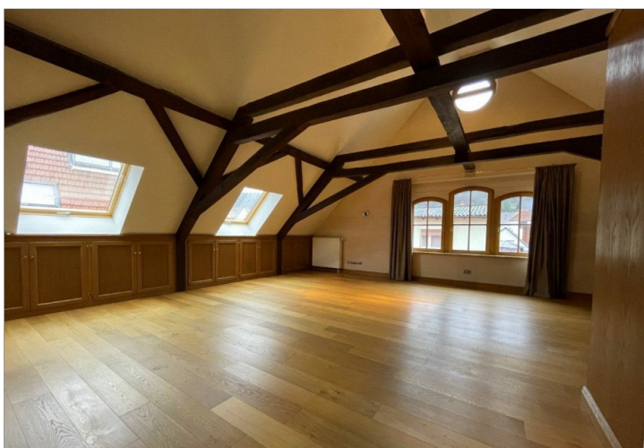
Wohnen - Schlafen - Arbeiten