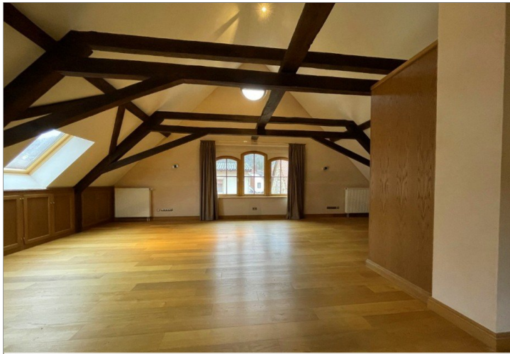
Wohnen - Schlafen - Arbeiten