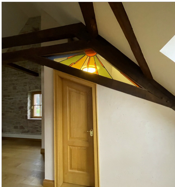
schöne hochwertige Details