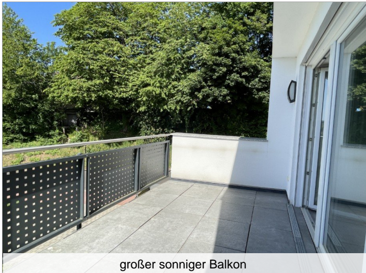
großer sonniger Balkon