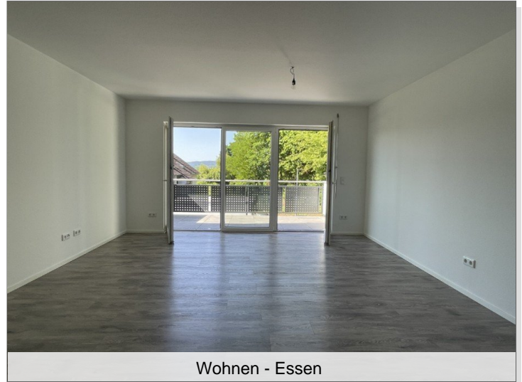
Wohnen - Essen