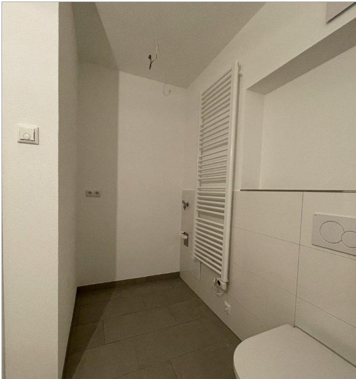
Bad und Waschecke