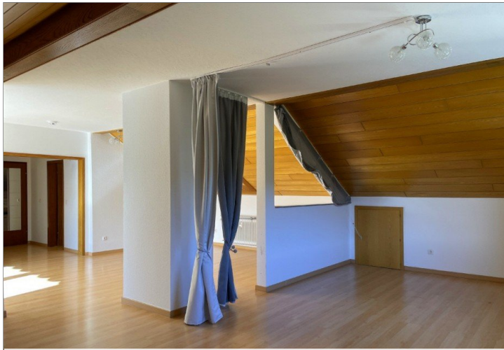
schlau gelöst - Schlafbereich