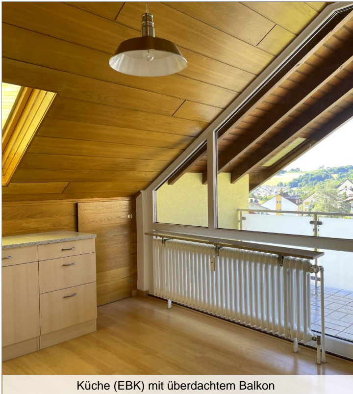
Küche (EBK) mit überdachtem Balkon