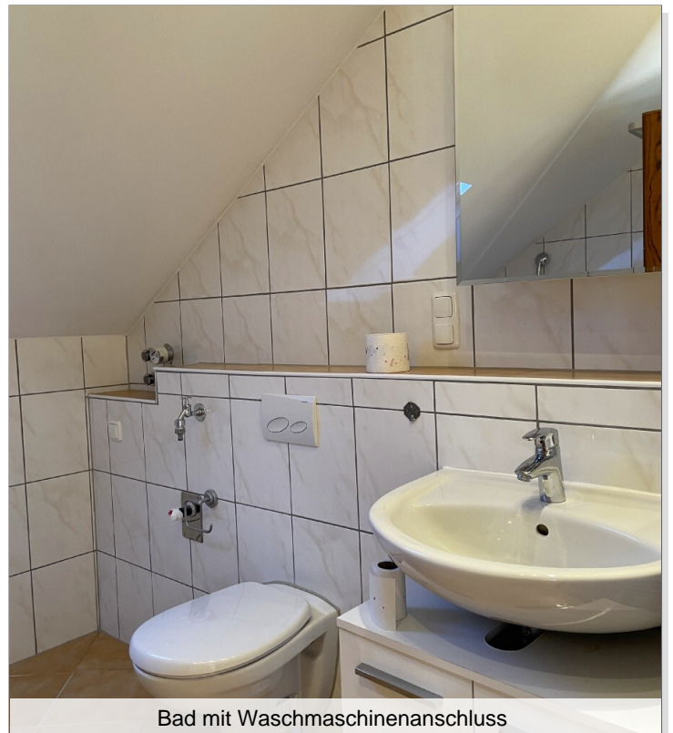
Bad mit Waschmaschinenanschluss