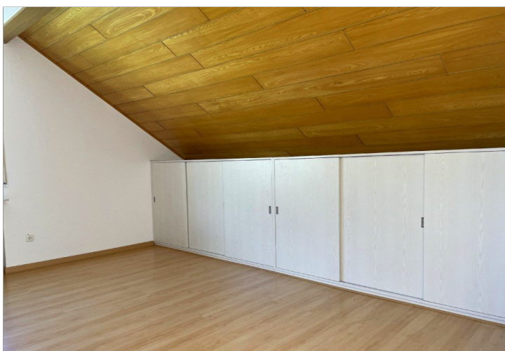
reichlich Stauraum - Einbauschränke