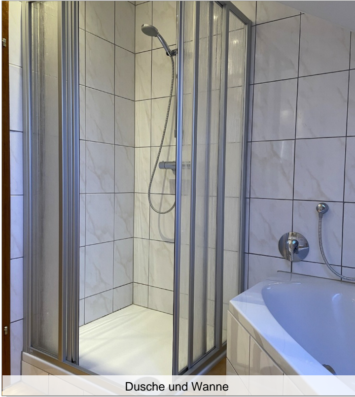
Dusche und Wanne