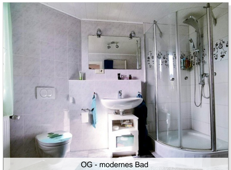
OG - modernes Bad