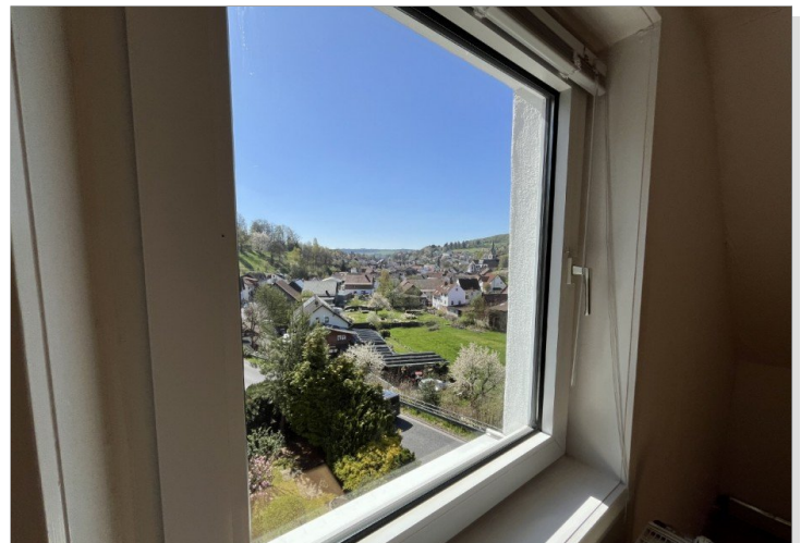
Schöne Sicht in das Tal