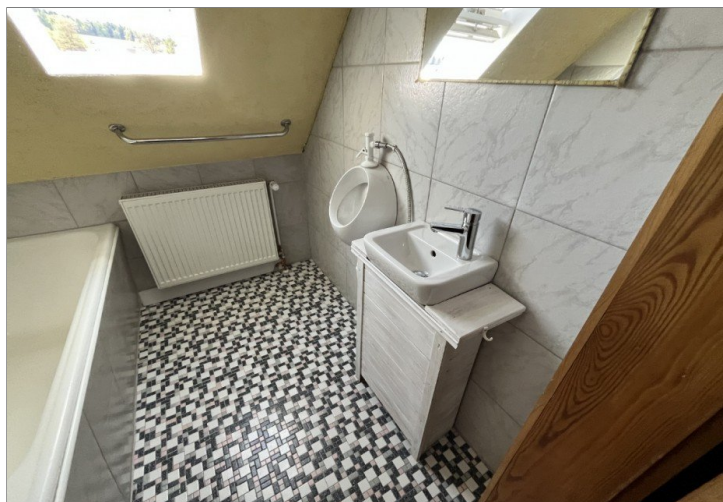
DG - Bad